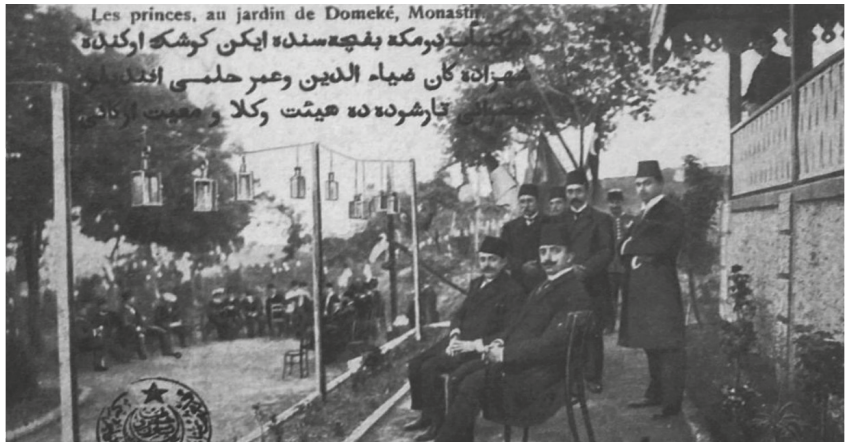
Fotoğraf 9 Haşmet-me'ab (Padişah) Dömeke Bahçesi'nde iken köşk önünde şehzadegan (şehzadeler) Ziyaeddin ve Ömer Hilmi Efendiler ile zevatı, karşıda da heyet-i vükelâ (Sadrazam ve bakanlardan oluşan heyet) ve maiyyet erkânı (memurlar) (Parantez içindeki açıklamalara gerek var mı?)