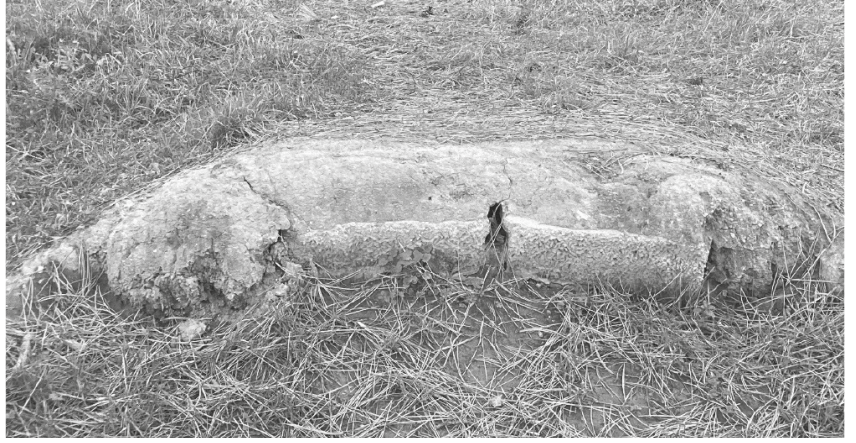
Fotoğraf 8 Sultan Reşad'ın 1911 yılı Rumeli seyahati sırasında tahsis olunan Kerim Paşa (Dömeke) Bahçesi'nin Köşkü'nün temel izleri

Askerî bandonun çaldığı müzikler, yüksekte âdeta bütün şehre yankılanıyordu. Şehzadeler de köşkün önünde din-