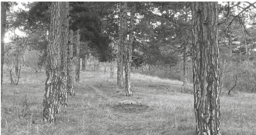
Fotoğraf-7 Sultan Reşad'ın 1911 yılı Rumeli seyahati sırasında tahsis olunan Kerim Paşa (Dömeke) Bahçesi'nin Köşkünün bugün bulunduğu yer