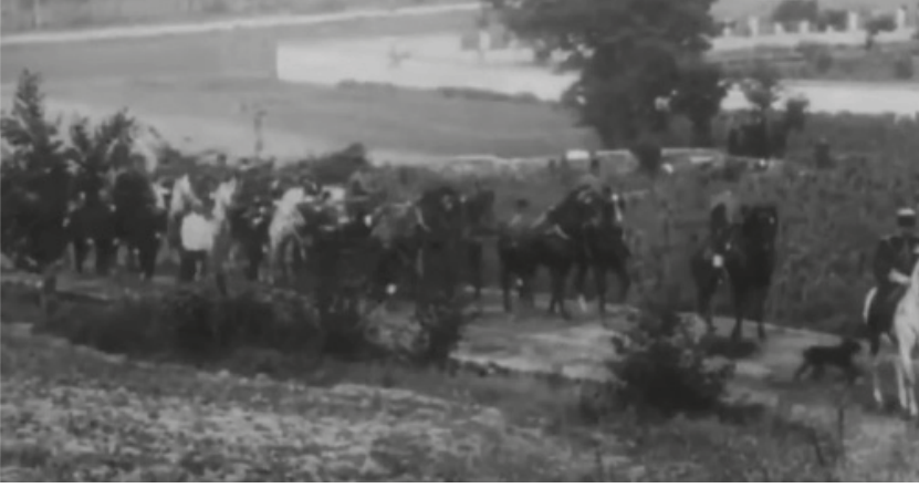
Fotoğraf-2 Sultan Reşad'ın 1911 yılı Rumeli Seyahatinden. Manastır Kerim Paşa Bahçesi'ne çıkışı (Manaki Kardeşler videosu)

tanınmayacak derecede geliştirerek imrenilecek bir duruma ulaştırır. 1897 Türk-Yunan harbi nedeniyle ordulara düzenli olarak erzak ve mühimmat sevkiyatı için araba ve hayvan tedarik etmek, asker nakliyesini düzenli bir şekilde sağlamak noktasında gösterdiği başarılarının yanı sıra, şehirle ilgili işlerini de aksatmadan yerine getirir. Manastır'daki Gureba hastanesine gelir getirmek üzere bir memleket bahçesi yaptırır. Şehir içinde gerek yeni, gerekse tamir edilen binalardan başka, memleket bahçesine, kışlalar ve hastane bahçesine giden şose yollar inşa eder.