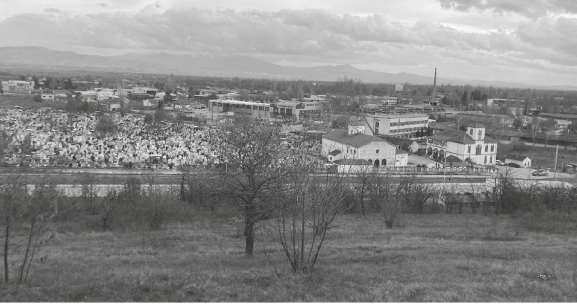
Fotoğraf-4 Manastır Kerim Paşa Bahçesi'nin önündeki Bukovska Caddesi ve Ortodoks Mezarlığı ile sonradan yapılan kilisenin bahçenin bulunduğu tepeden görünüşü

hakkında haksız suçlamalarda bulunan bazı kimselerin Babîli'ce taltif edilmesi üzerine, başarılarını geçersiz kılacak bu gibi haksız ithamlar karşısında 25 Ocak 1896'da istifa etmek için bir dilekçe verir. Dilekçesinde Padişah'a bütün samimiyetiyle hizmet etmeye devam edeceğini de ifade eder. İstifası kabul edilmeyen Paşa, görevine 1900 yılına kadar devam eder.