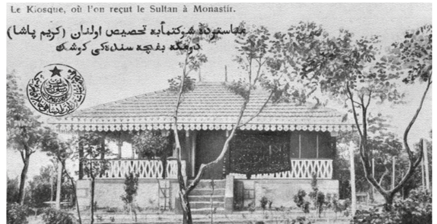
Fotoğraf-5 Sultan Reşad'ın 1911 yılı Rumeli seyahati sırasında tahsis olunan Kerim Paşa (Dömeke) Bahçesi'nin Köşkü

Sultan II. Abdülhamid'in tahta çıkışının 25. yıldönümü münasebetiyle Manastır'da daha önce emsali görülmemiş hazırlıklar yapılır. Cülus-ı Hümayun günü şehrin her tarafı dua levhalarıyla donatılmış, askerî ve mülkî erkân resmî elbiseleri ve nişanlarıyla hazır buldukları halde hükümet konağına gelerek Vali Abdülkerim Paşa'ya tebriklerini sunmuşlardır. Vali tarafından okunan nutkun ardından duagû tarafından dualar okunur. Osmanlılar için bir millî bayram niteliğinde olan bugün şerefine darüşşafaka ve sanayi mektebinin açılışları yapıldığı gibi singer dikiş ma-