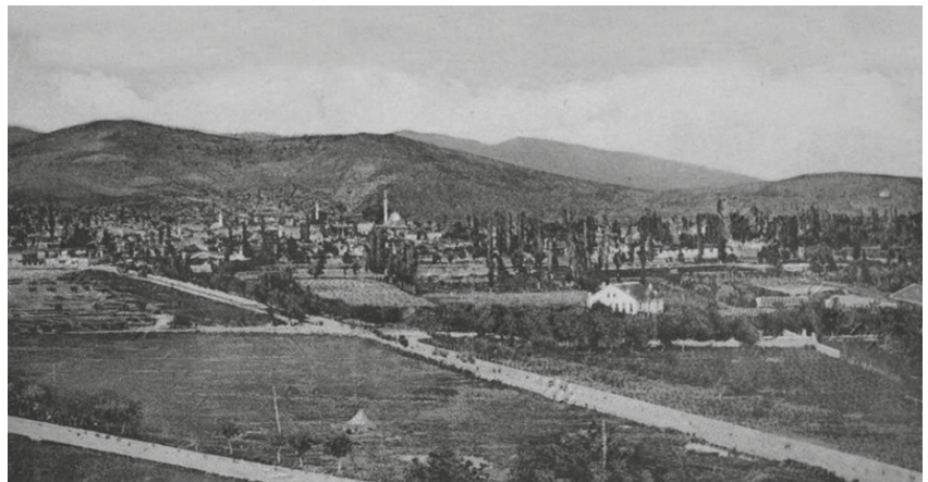
Fotoğraf-1 Manastır şehrinin 19. yüzyıl sonu-20. yüzyıl başındaki genel görünüşü