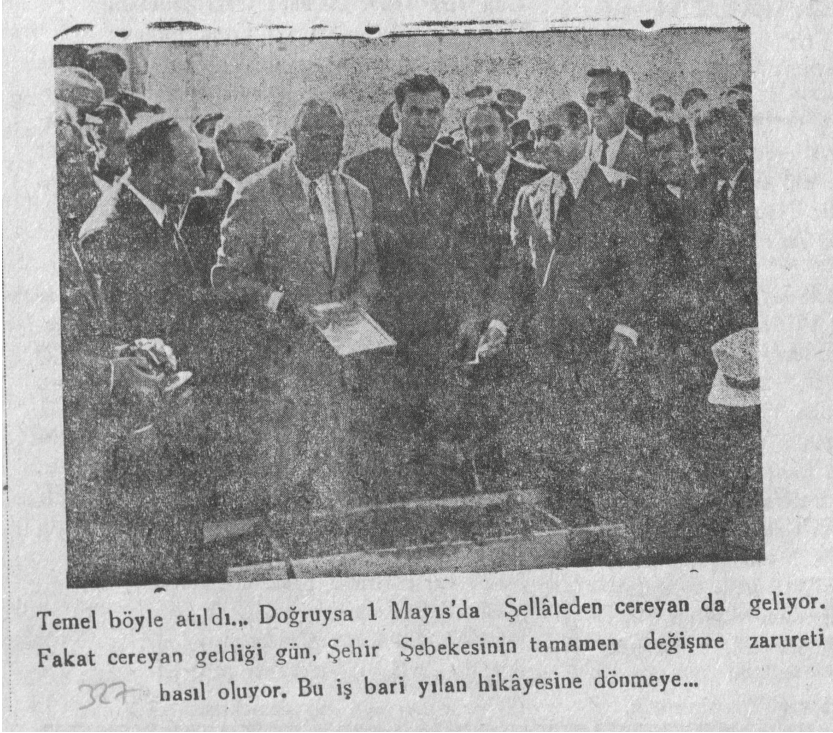
Temel böyle atıldı.. Doğrusya 1 Mayıs'da Şellâleden cereyan da geliyor. Fakat cereyan geldiği gün, Şehir Şebekesinin tamamen değişme zarureti hasıl oluyor. Bu iş bari yılan hikâyesine dönmeye...

ticelendirilmiştir. Bu dönem Erzurum'un yeni sanayi tesislerine kavuştuğu bir dönemdir. DP iktidarının sona erdiği 1960 yılına kadar Et Kombinasi, Şeker Fabrikası, Pasinler Tuğla Fabrikası, Yem Fabrikası ve Atatürk Üniversitesi gibi büyük kurum ve kuruluşlar ortaya çıkmış ve bunların ciddi bir elektrik ihtiyacı hasıl olmuştur.