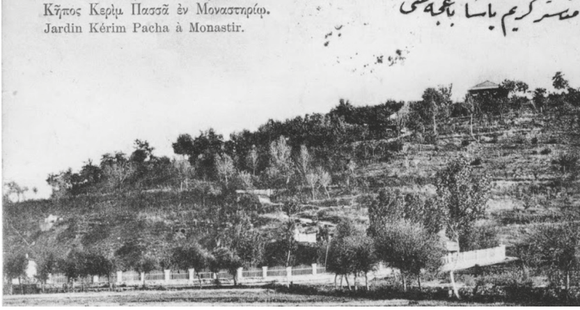
Fotoğraf-6 Sultan Reşad'ın 1911 yılı Rumeli seyahati sırasında tahsis olunan Kerim Paşa Bahçesi

kinalarının Manastır şubesine Osmanlı arması yerleştirilmesi de gerçekleştirilir. Aynı günün akşamı Vali tarafından Abdülkerim Paşa Bahçesi'nde yapılan tören anlatılmaz güzelliğindedir. Bahçe adeta bir ışık deryasıdır. Orkestra çaldığı parçalarla hazır bulunanlara neşe saçar. Kışla binası, hükümet konağı, adliye dairesindeki ışıklandırmalar her yeri alabildiğine aydınlatır.