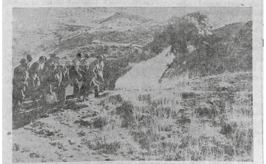
İŞTE BÖYLE GİDİLDİ: Dokuz yıldan beri Erzurum'un beklediği Tortum Hidro-Elektrik santralının ikmalî bu gidişle daha yıllarca devam edecek. Fakat, temel atma merasimine yukarıdaki resimde görüldüğü gibi, başta Başvekilimiz olmak üzere sür'atle gidildi. Sür'atle inşaat başlandı..... Gerisi malûm... Temel atma merasiminde gösterilen hassasiyet, inşaatın ikmalinde de gösterilse idi, ne iyi olurdu?.. Amma gösterecek kim?.....

Bu arada, şehrin elektrik şebekesini Tortum Santrali'nden gelecek elektrığe göre düzenlemek için 1953-55 yılları arasında bazı çalışmalar yapıldı. Yeni elektrik şebekesinin ihalesi 1953 yılında yapılırken, abonelerin tesisatları gözden geçirilmeye başlandı. Tesisatlarını fenni usullere ve talimatlara göre düzenlemeyen abonelerin elektrikleri kesildi. Şebekenin yenilenmesi sırasında yaklaşık 15 yıl önce yapılan eski şebekedeki malzemenin önemli oranda yandığı veya bir şekilde çürüdüğü görüldü. Bunun nedeni, şebekenin noksan olmasından ziyade, abone branşman ve kolonlarının bozuk veya gayri fenni olmasıydı. Yapılan sıkı takip neticesinde 1955 yılı sonlarına kadar şehirdeki 4.000 abonenin %80'i kolonlarını yeniledi. Yeni şebekenin yapımı yaklaşık 1.000.000 liraya mal olmuştu. 15