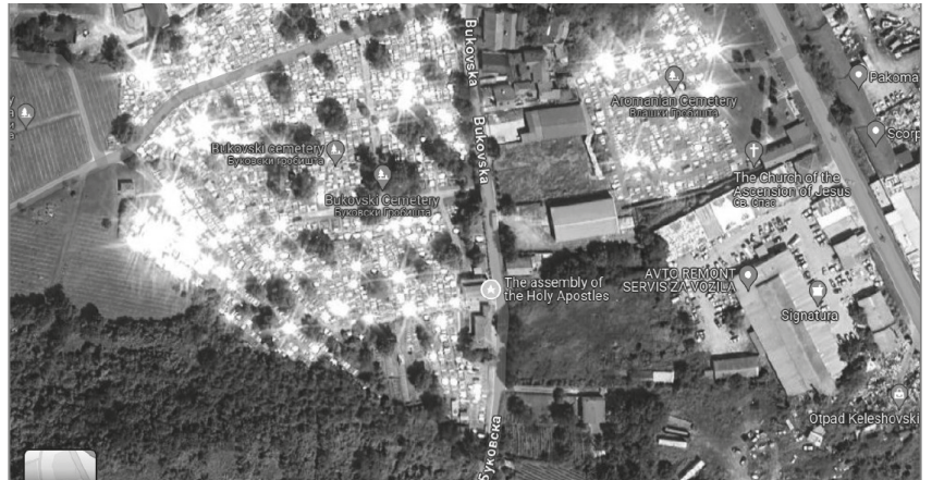
Fotoğraf-3 Manastır Kerim Paşa Bahçesi'nin yerinin günümüzde Google mapsten görünüşü